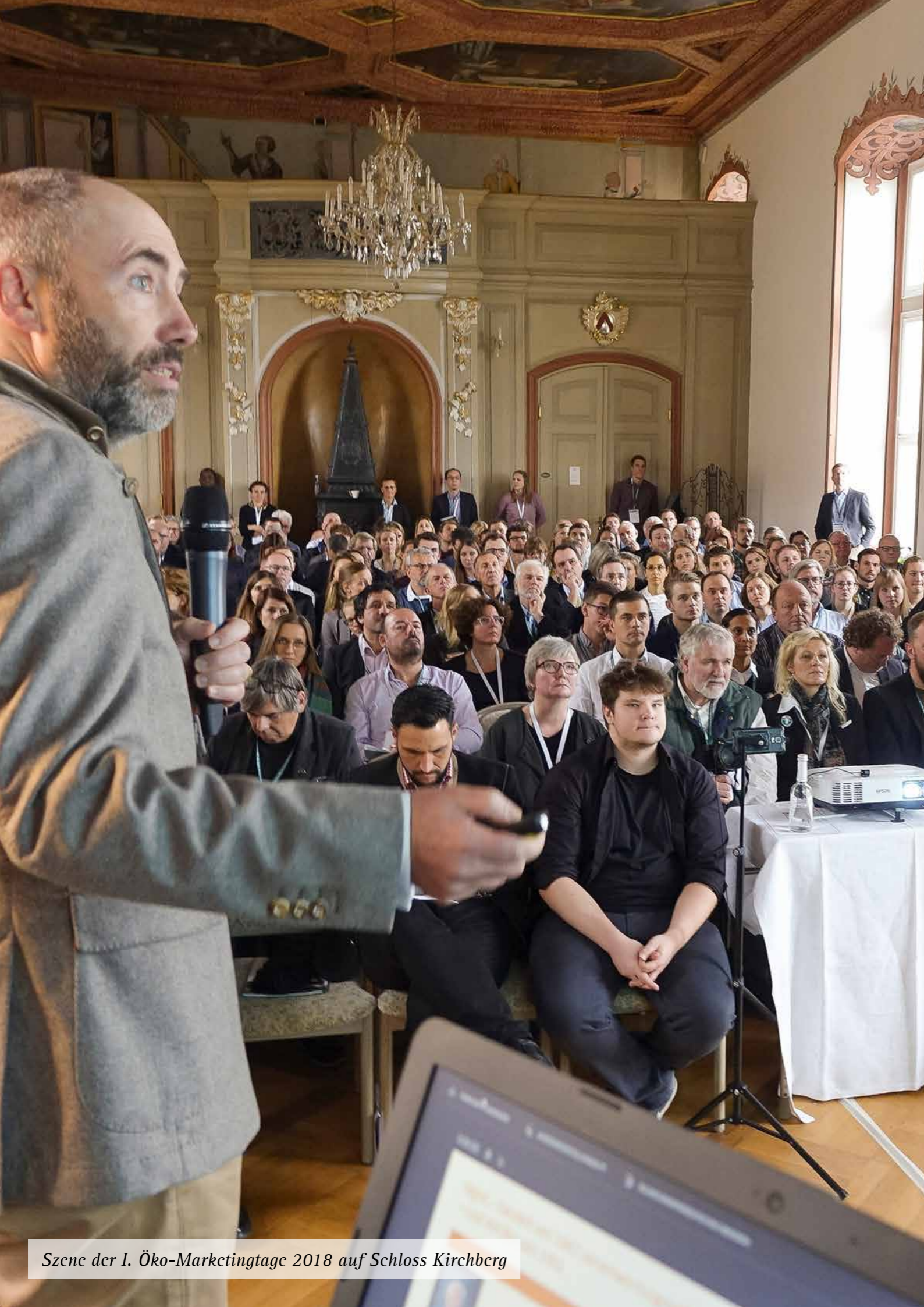
Szene der I. Öko-Marketingtage 2018 auf Schloss Kirchberg