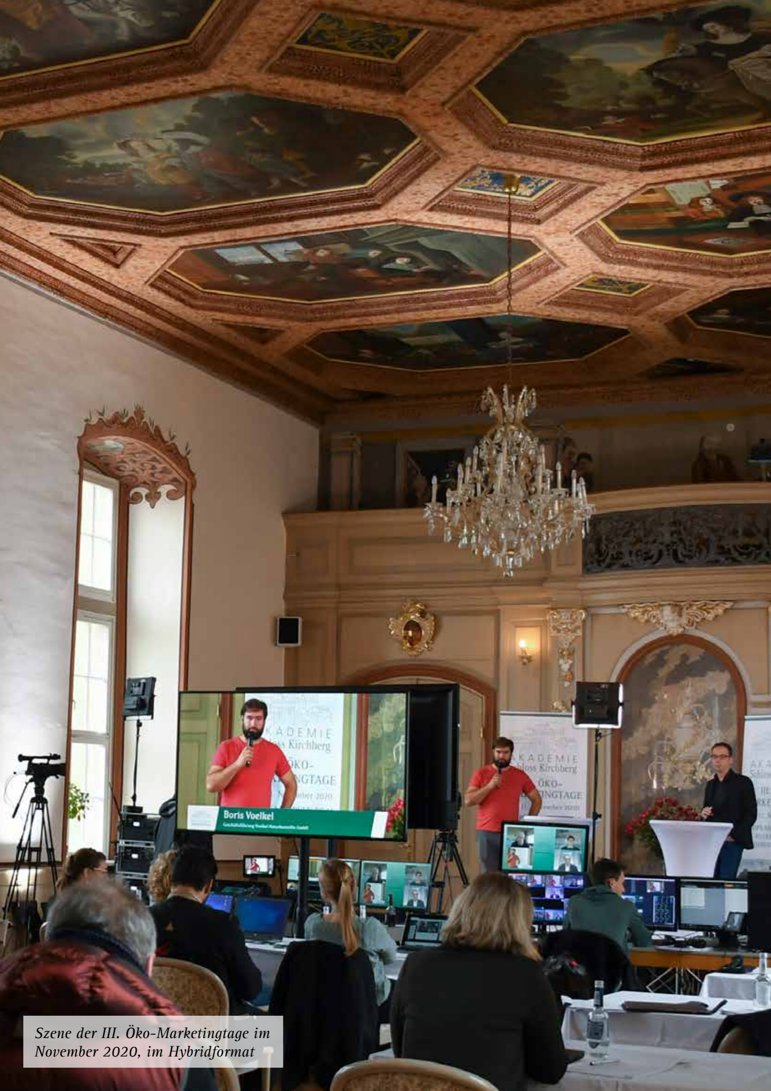
Szene der III. Öko-Marketingtage im November 2020, im Hybridformat