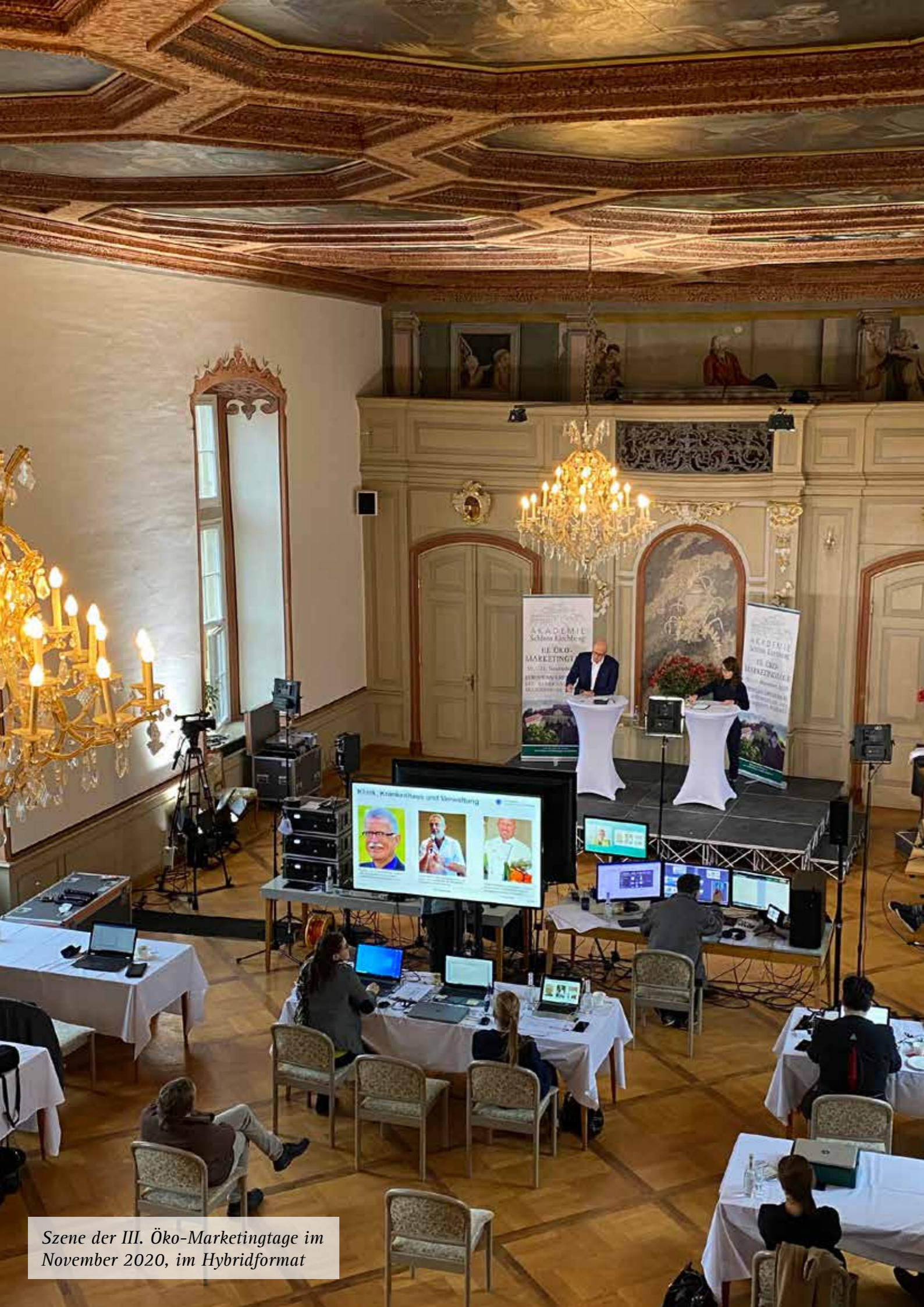
Szene der III. Öko-Marketingtage im November 2020, im Hybridformat